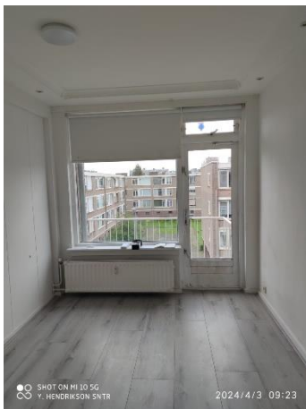
Figuur 4 Slaapkamer 2