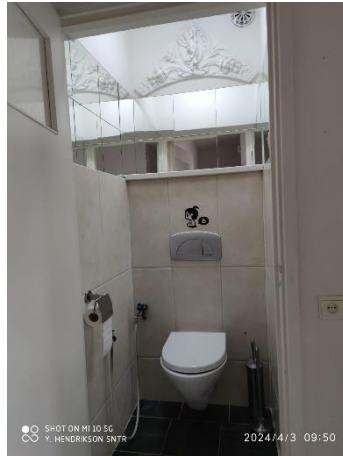
Figuur 8 toilet