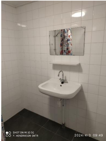
Figuur 7 badkamer