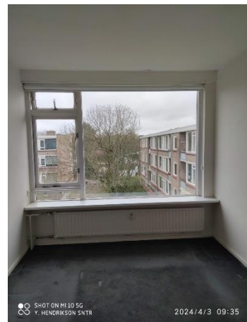
Figuur 3 slaapkamer 1