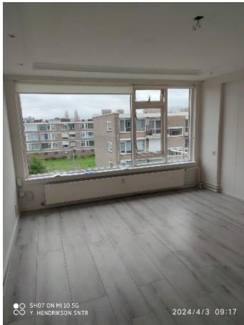
Figuur 1 woonkamer

- Bij voldoende animo zullen één of twee mogelijkheden voor bezichtiging worden gepland. U krijgt na aanmelding bericht van SNTR over de mogelijkheden. De sluitingsdatum voor het aangeven van uw interesse is op 4 augustus 2024. Hierna is het niet meer mogelijk om u in te schrijven voor de woning.