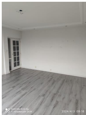
Figuur 2 woonkamer