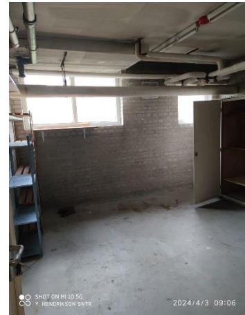
Figuur 9 berging