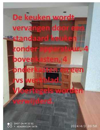
Figuur 6 keuken