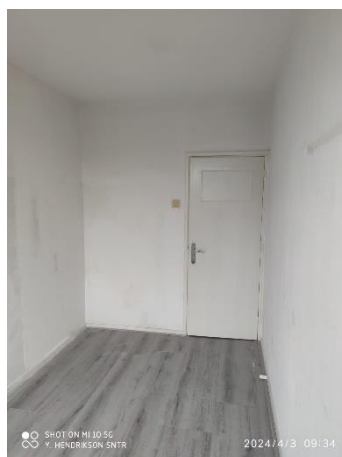
Figuur 5 slaapkamer 3